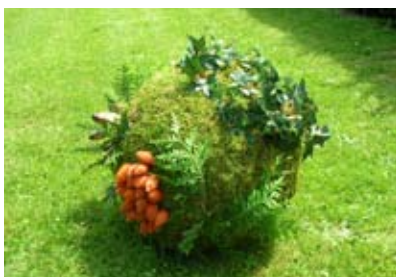
Le jardin planétaire vu par les élèves de CM2 de Mareil-Marly.

« La Terre est un seul et même jardin », écrit le paysagiste Gilles Clément. Chacun d'entre nous peut jouer un rôle pour « cultiver » notre planète, la sauvegarder et protéger les espèces qui y vivent.